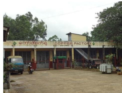
POP POPコーヒー工場外観 (元国営コーヒー工場)