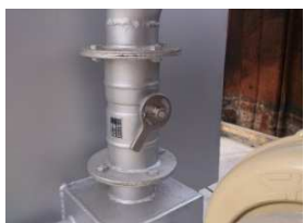
エジェクターダンパー