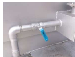
灰化促進炉床エア ＜オプション品＞