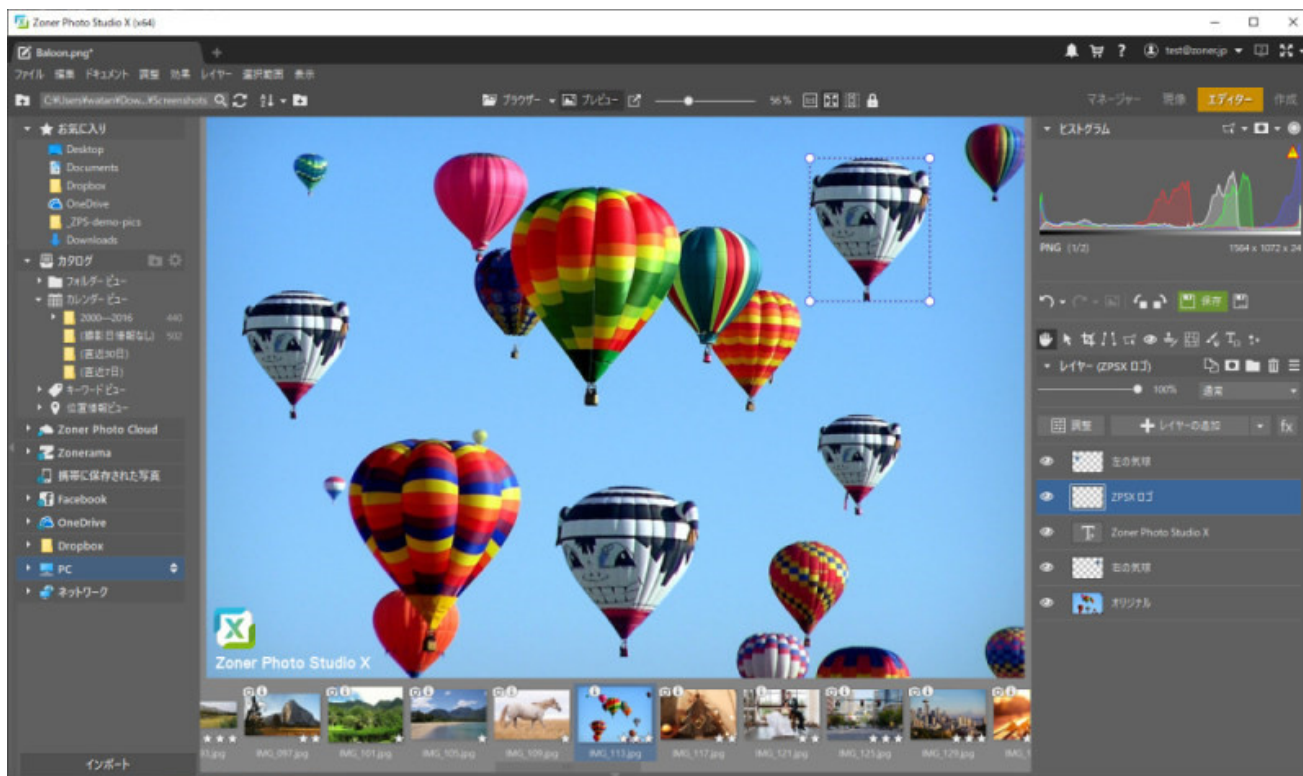
エディター画面：レイヤー機能

撮影場所によって、写真を分類、閲覧できます。新しい Zoner Photo Studio X のカタログは「位置情報ビュー」で、写真を、撮影場所に応じて、わかりやすいグループに分類します。